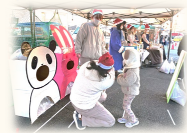
おやじダンサーズ