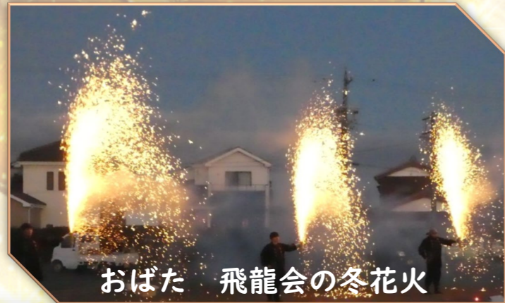
おばた 飛龍会の冬花火