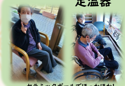
セラミックボールでほっかほか!