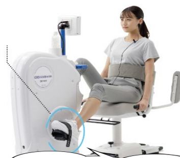
リカンベントバイク