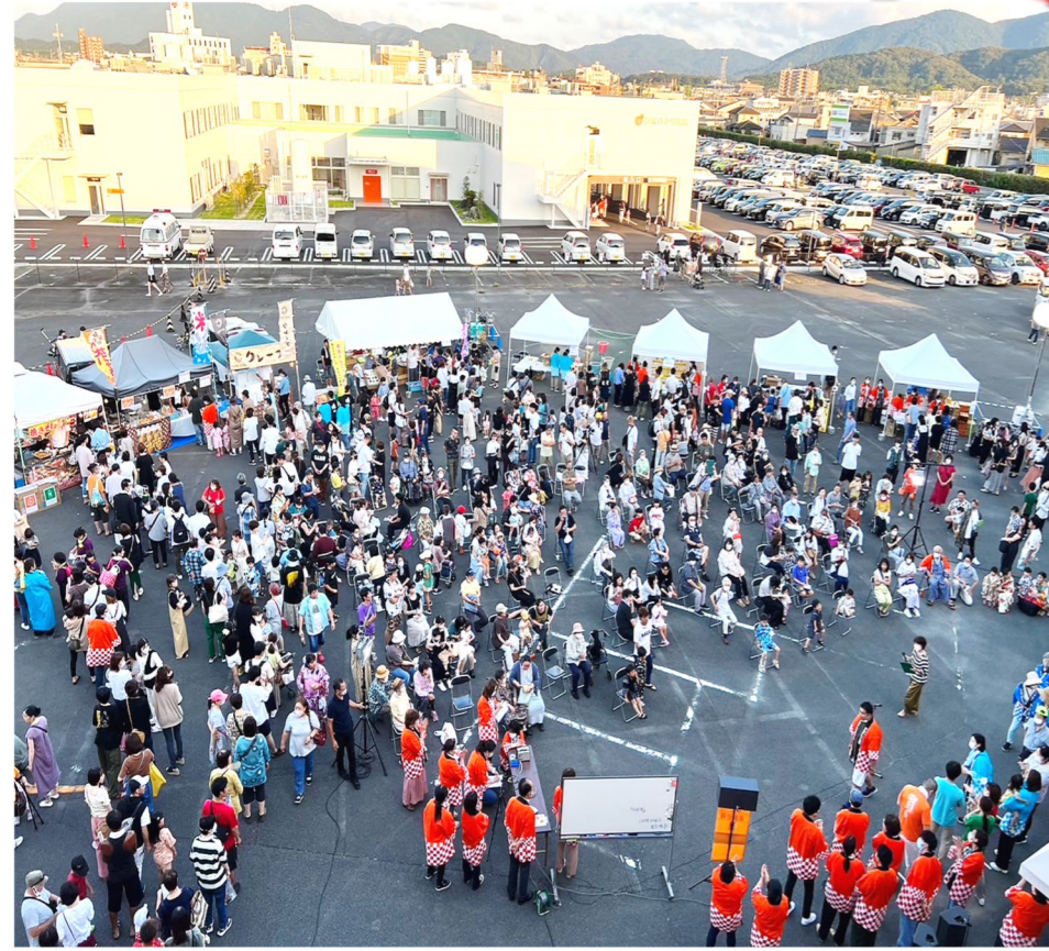
7/22 (土) 御菌ひかりタウン夏まつり ご来場ありがとうございました!(^^)!