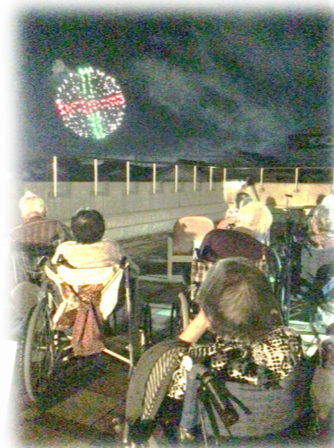
ベランダで鑑賞しました